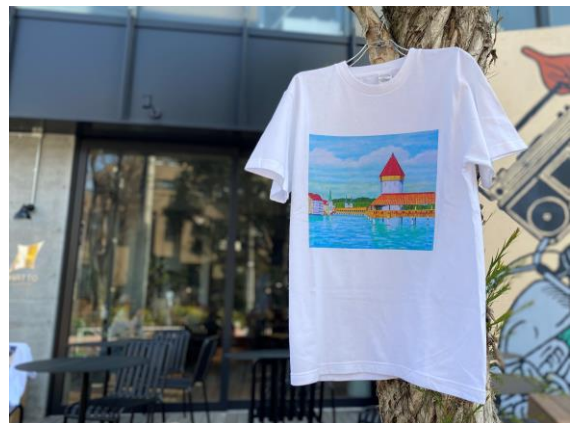
実際の T シャツ