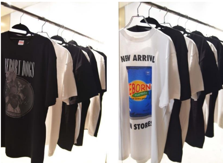
コンセプトである“REBORN”から着想を得たグラフィック

また、会場で売れ残った寄付商品は、学生団体「Rethink Fashion Waseda」に譲渡し、アップサイクルや寄付に充てました。