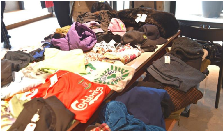
洋服以外にも、帽子やバックなど様々

価格は 100 円均一、500 円均一のものから数千円～数万円代まで幅広く、来店したお客様は思いおもいに服を手にとっていました。