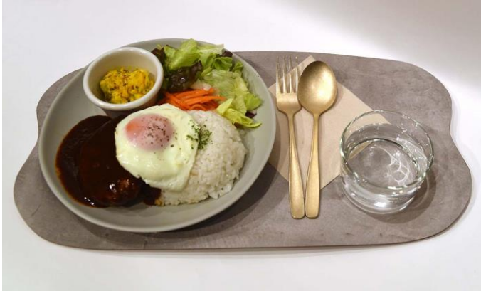
～濃厚なデミグラスソースの味わい～ ロコモコ丼 990 円 (+ tax 1089 円)