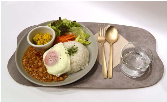
～バジルとスパイスが効いた～ ガパオライス 990 円 (+ tax 1089 円)

+320 円 (税込 352 円) でドリンクセットにできます。また、プレートメニューとスイーツセットのご注文で 20%OFF となります。