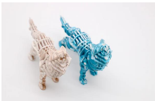
「オオカミ」をマーカーや絵の具でアレンジ

ウッドパズルは着色されていないため、マーカーや絵の具などで色をぬって、自分だけの作品にアレンジができるのも魅力的なポイント。もちろん、木の素材をそのまま活かして、お家のインテリアとして飾っても素敵です。