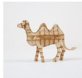
(左から、サメ、カメ、タツノオトシゴ、ラクダ)