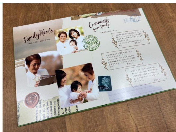
【見開きイメージ】指紋がつかないつるつるとした質感、フルフラットで見やすいつくり。