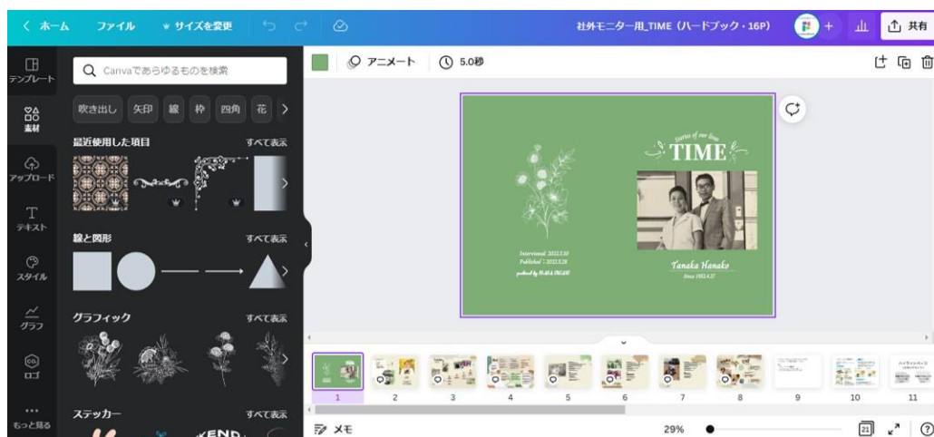
直感的に編集できるCanva操作画面