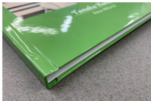
【完成イメージ】表紙は光沢感があり、ハードカバーでしっかりとした仕上がり。