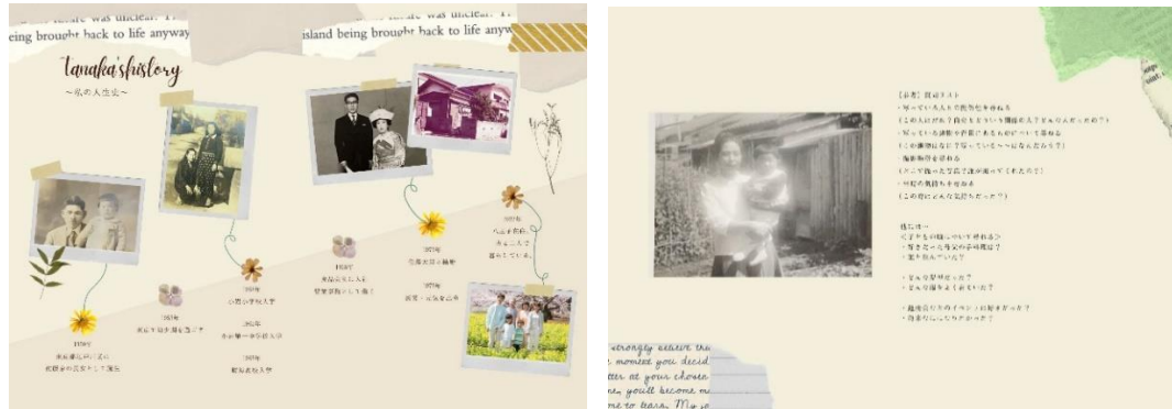
(左)年代ごとに人生を振り返るページ (右)回想法を使ったインタビューで、思い出をまとめるページ

基本的には、用意されたテンプレートに沿って、写真と文字を入力していただくだけで、だれでも簡単に作成いただけます。Canvaにはたくさんのテンプレートや素材がそろっているので、もちろんオリジナルにアレンジしていただくことも可能です。