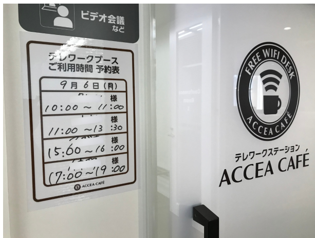
▲西新宿店における実際の予約表。朝から晩まで予約が入っている。

「One-Bo」が導入されている全国4都府県12店舗の内、特に西新宿店、渋谷店、新大阪店においては「One-Bo」が絶え間なく利用されていること、ピーク時には使用率が100%となっていることがわかっています。